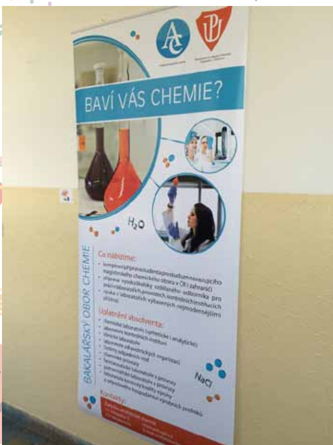
▼ Vítězný banner